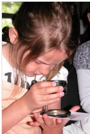
Mit der Lupe untersuchen die kleinen Detektive Fingerabdrücke.

„Rosenheim-Cops“ oder die „Drei ???“. Krimiserien und Detektivgeschichten ziehen Zuschauer und Leser in ihren Bann. Und so hatten sich 140 kleine und große Detektive zu dieser spannenden Bildungsveranstaltung im Berufskolleg am Eichholz eingefunden.